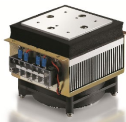
【サーモモジュール 標準アセンブリ品】

また、直流電源の極性を入れ替えると、この現象が逆転し、逆方向に熱の移動を行いますので、同じ面で冷却・加熱のいずれの目的にも使用することができます。その機能によりセンサー・制御器と合わせて使用する事で精密な温度調節も可能となります。