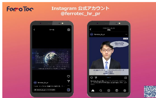
【左: CMカット / 右: アカウントイメージ】